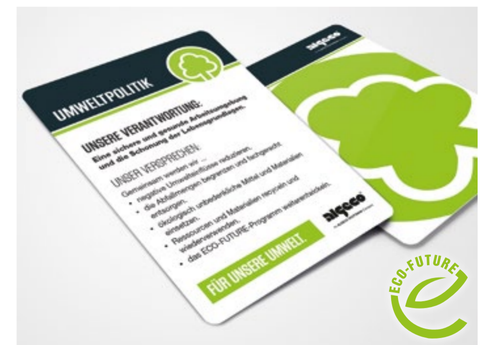
Ausgewählte Umweltziele auf einen Blick. Der schonende Umgang mit natürlichen Ressourcen hat bei ALGECO Priorität.