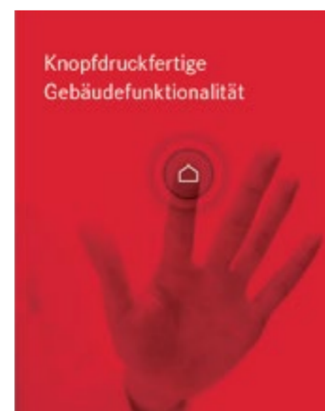
ELWO bietet per Knopfdruck besten Schutz für Personen und Sachwerte.

ALGECO errichtete TV-Studio für NEWTOPIA. Innerhalb von nur 14 Tagen haben wir eine 1.900 m 2 große Containeranlage sowie die nebenan stehende Scheune mit modernster Brandmelde-technologie und Sicherheitsbeleuchtung ausgestattet.