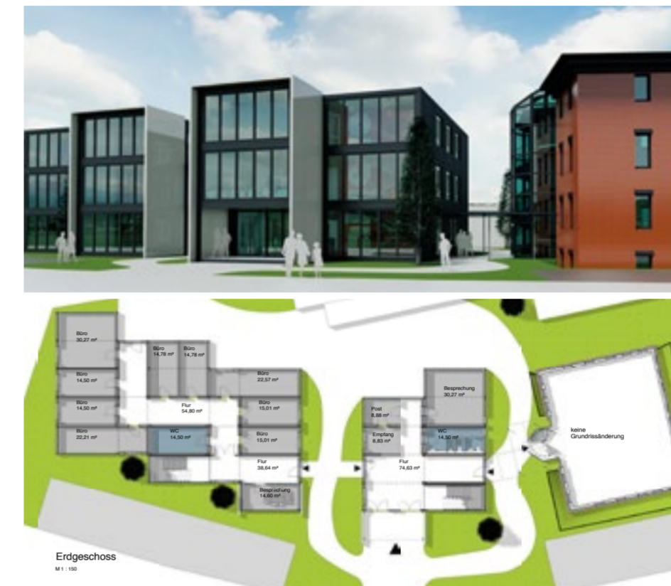
Das Technical Innovation Center beschäftigt sich auch mit zukunftsweisenden Bürokonzepten.