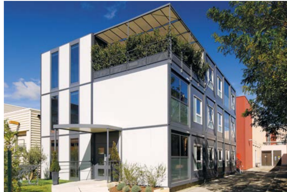
Repräsentativ und elegant: PROGRESS eröffnet Architekten viele individuelle Gestaltungsmöglichkeiten.

Die neue Dimension des modularen Bauens. PROGRESS ist Architektur auf Zeit und erfüllt höchste Ansprüche an Design, Komfort und Sicherheit.